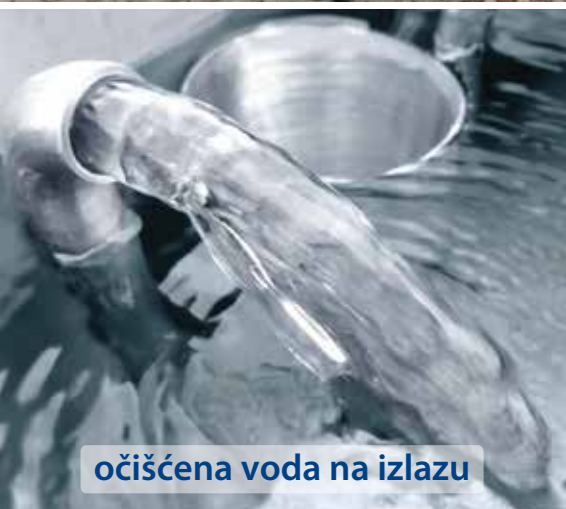
očišćena voda na izlazu