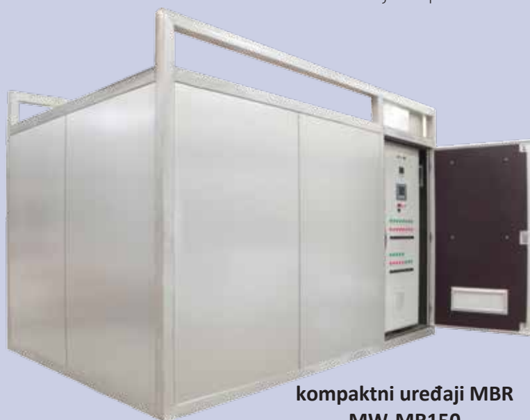
kompaktni uređaji MBR MW-MR150