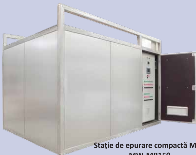
Stație de epurare compactă MBR MW-MR150