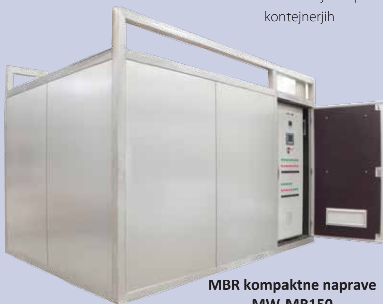
MBR kompaktne naprave MW-MR150