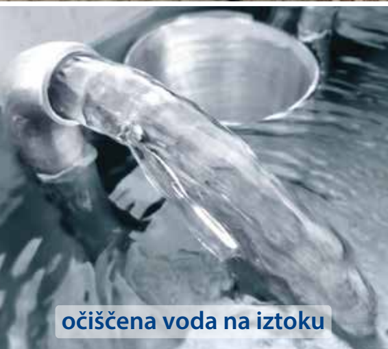
očiščena voda na iztoku