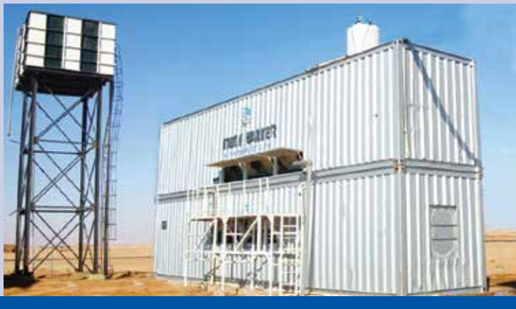
Umkatti - Контейнеризирана станция за питейна вода 1200 m 3 /d, Хартум - Судан