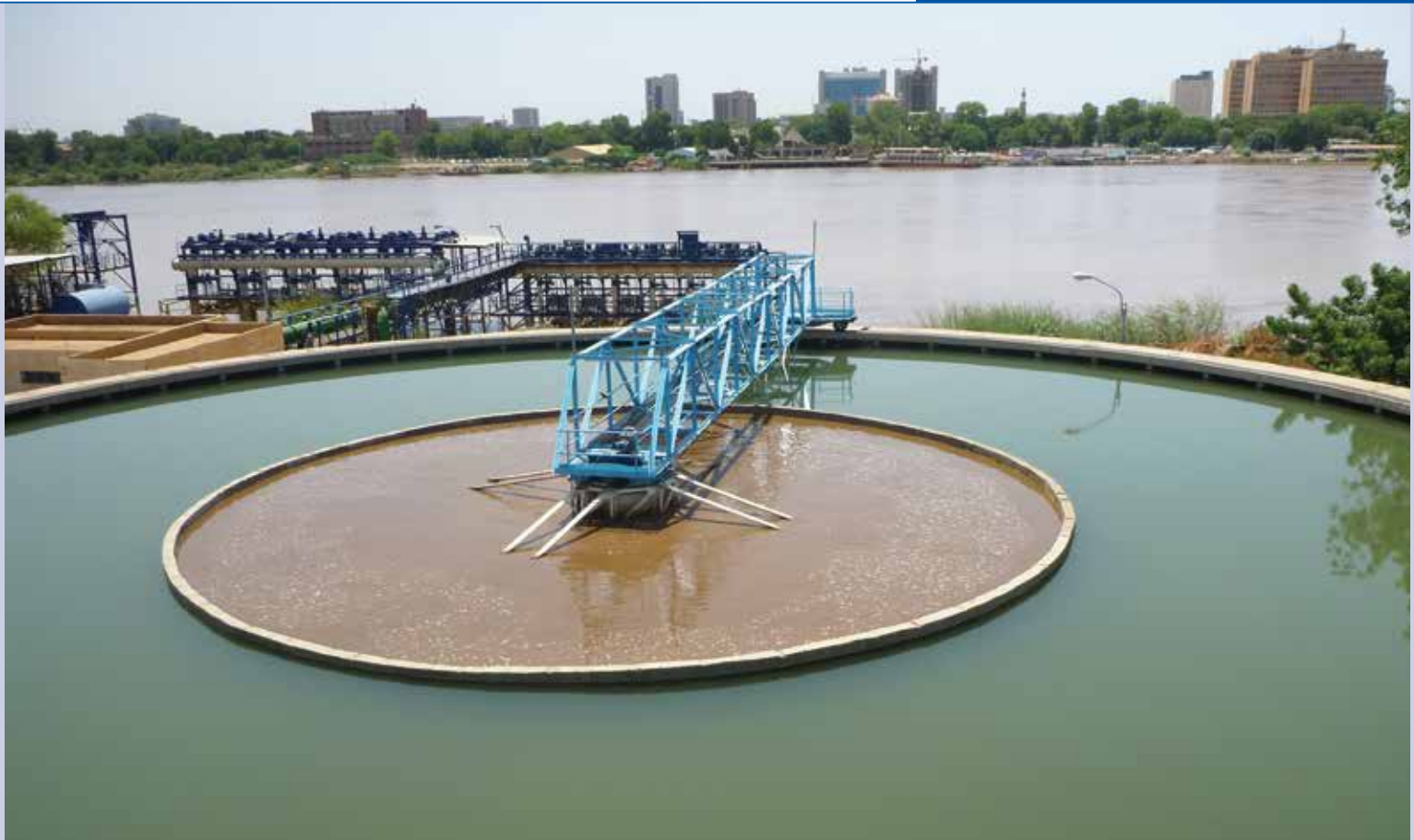
Ваху - Станция за питейна вода, Преустройство и обновяване (350000 m 3 /d) - Северен Хартум, Судан