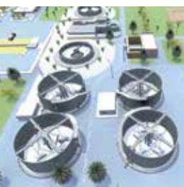
Битови отпадни води