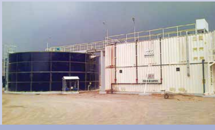
Abu Arish Станция за битови води, 1000 m 3 /d Abu Arish, Jizan - Саудитска Арабия