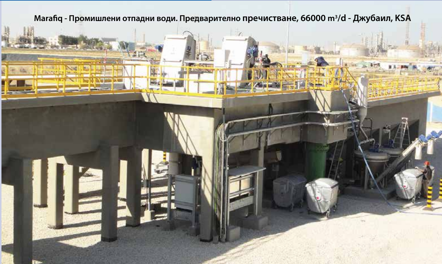
Marafiq - Промислени отпадни води. Предварително пречистване, 66000 m 3 /d - Джубаил, KSA