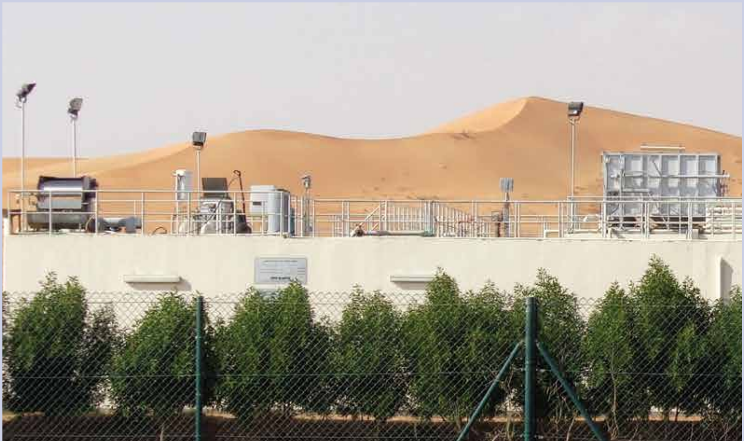
Al Ain Птицевъдство и клиника за птици & обработка. Пречиствателна станция за отпадни води, 400 m 3 /d, Al Saad, Al Ain – OAE