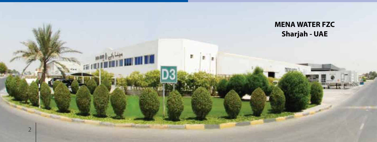
MENA WATER FZC Sharjah - UAE