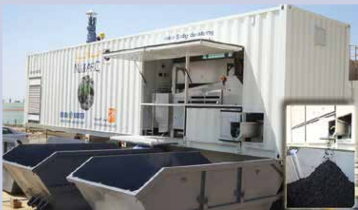
Marafiq Обезводняване на утайки - 4 мобилни инсталации 4 броя x 8 m 3 /d, Джубаил, Индустриална зона 1, Саудитска Арабия