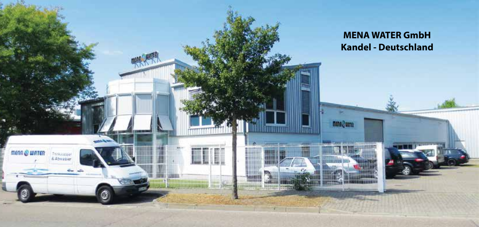
MENA WATER GmbH Kandel - Deutschland

MENA-Water поставя мащаби в развитието на услугите и на иновативни решения в областта на пречистването на отпадни и питейни води.