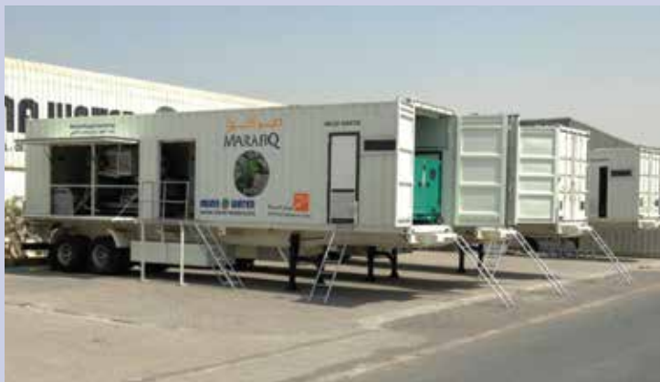
Marafiq dehidracija blata - 4 mobilna kontejnerska uređaja, 4x 8 m 3 /h, Jubail industrijska zona 1, Kraljevina Saudijska Arabija