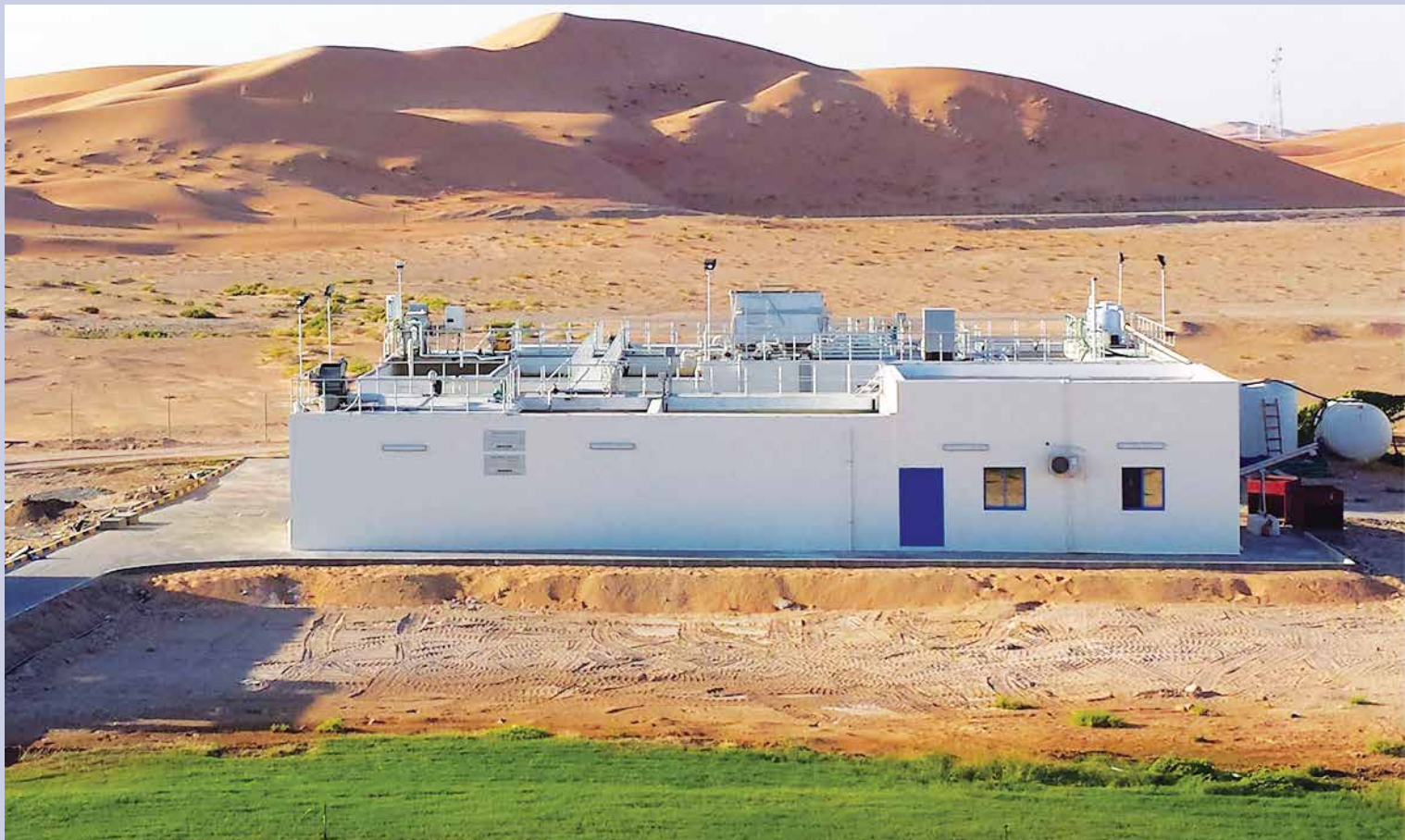
Al Ain – klaonica I obrada perutnine, uređaj za čišćenje otpadne vode, 400 m 3 /d Al Saad, Al Ain – Ujedinjeni Arapski Emirati