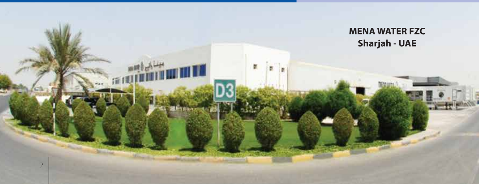
MENA WATER FZC Sharjah - UAE