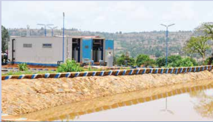
Bako uređaj za vodu za piće, 3.000 m 3 /d Etiopija