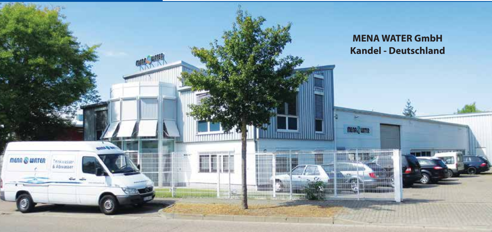
MENA WATER GmbH Kandel - Deutschland

MENA-Water postavlja nove standarde u razvoju i proizvodnji inovativnih rješenja i usluga na području obrade vode i otpadne vode.