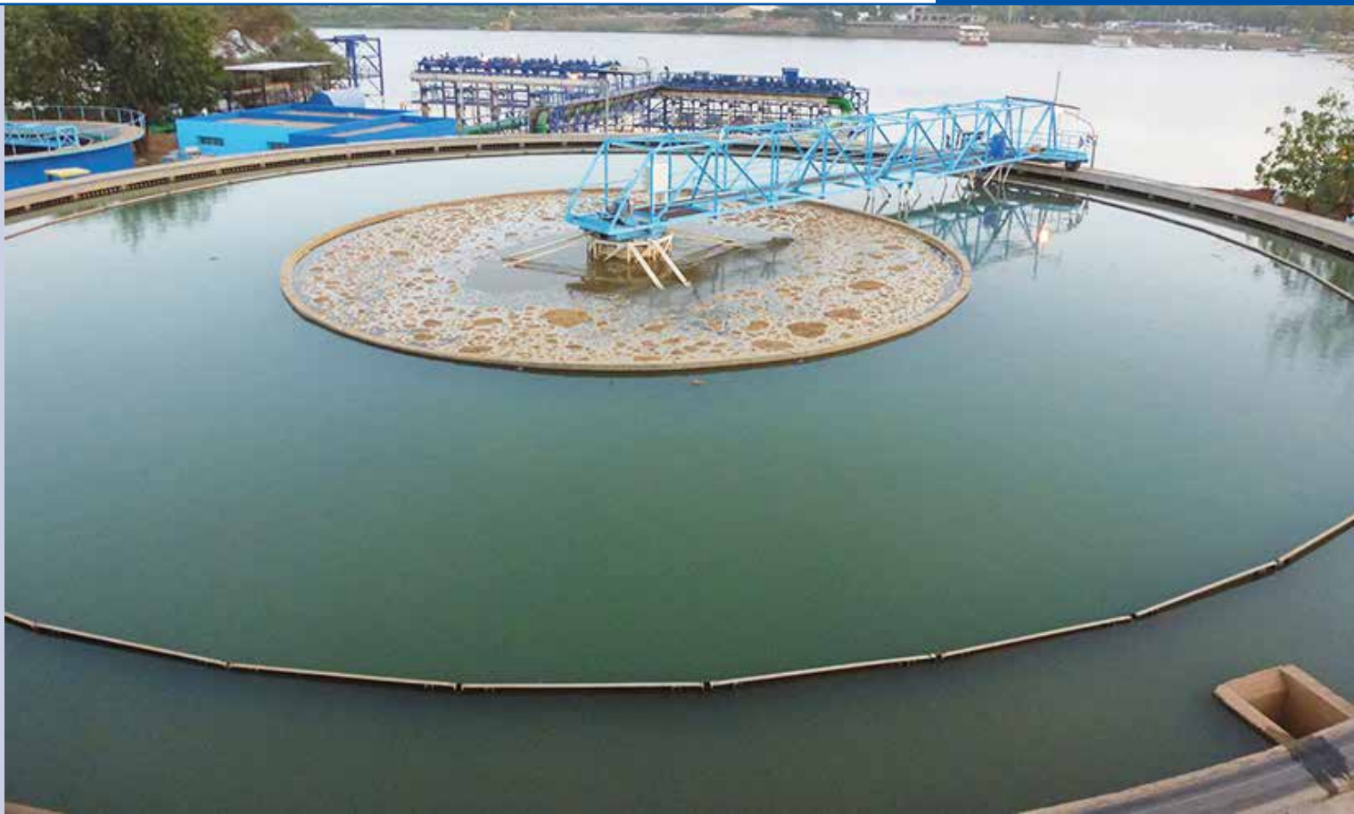
Sjeverni Khartoum - uređaj za vodu za piće, sanacija i proširenje kapaciteta na 4 milijuna ljudi