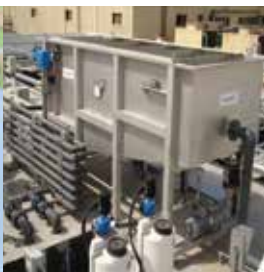
Industrijska otpadna voda