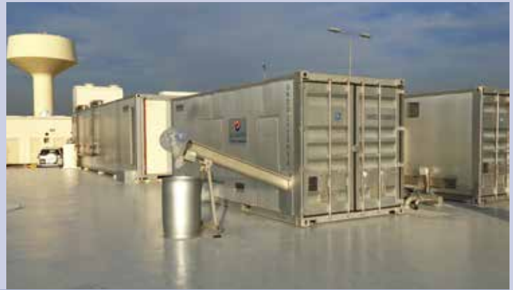
Durrat Al Bahrein MBR uređaj za čišćenje otpadne vode, 2.000 m 3 /d Bahrein