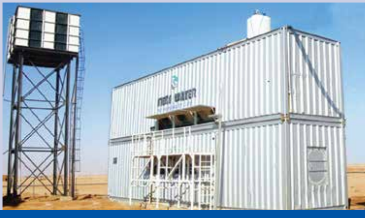
Umkatti – kontenerowe instalacje wodociągowe, 1200 m 3 /dzień, Chartum, Sudan