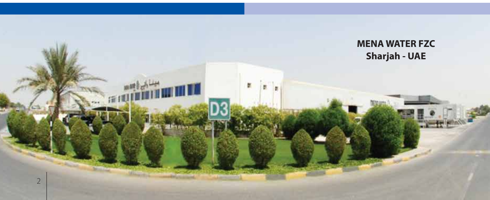
MENA WATER FZC Sharjah - UAE