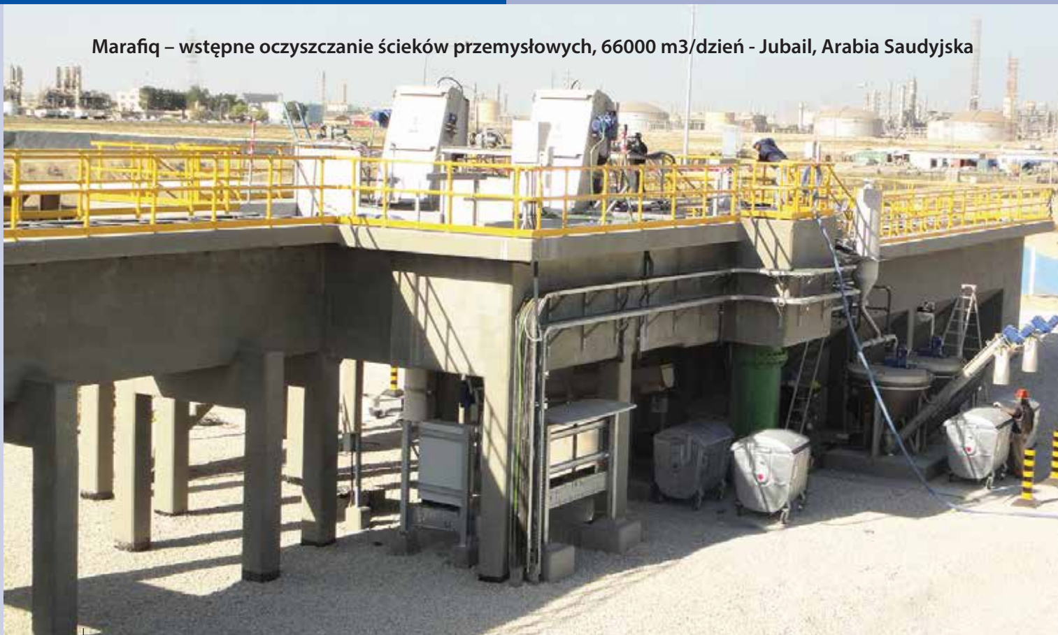
Marafiq – wstępne oczyszczanie ścieków przemysłowych, 66000 m 3 /dzień - Jubail, Arabia Saudyjska