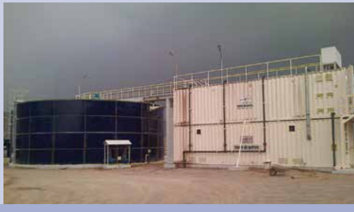
Oczyszczalnia ścieków ABU Arish, 1000 m 3 /d Abu Arish, Jizan – Arabia Saudyjska