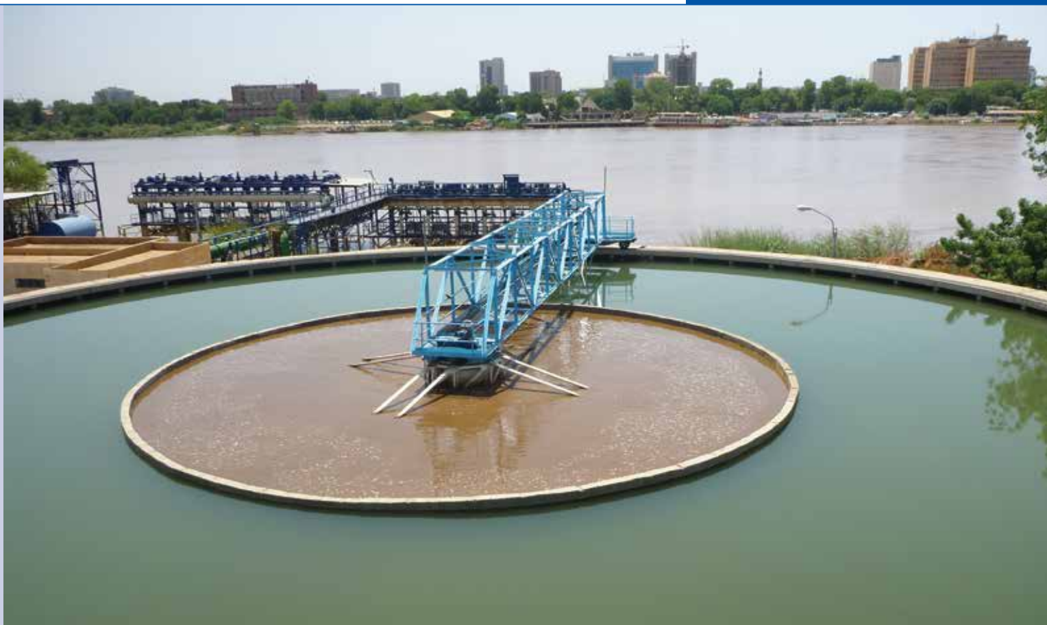
Bahry PWT – instalacja wodociągowa, renowacja i zwiększenie wydajności (350000 m 3 /dzień) - Północny Chartum, Sudan