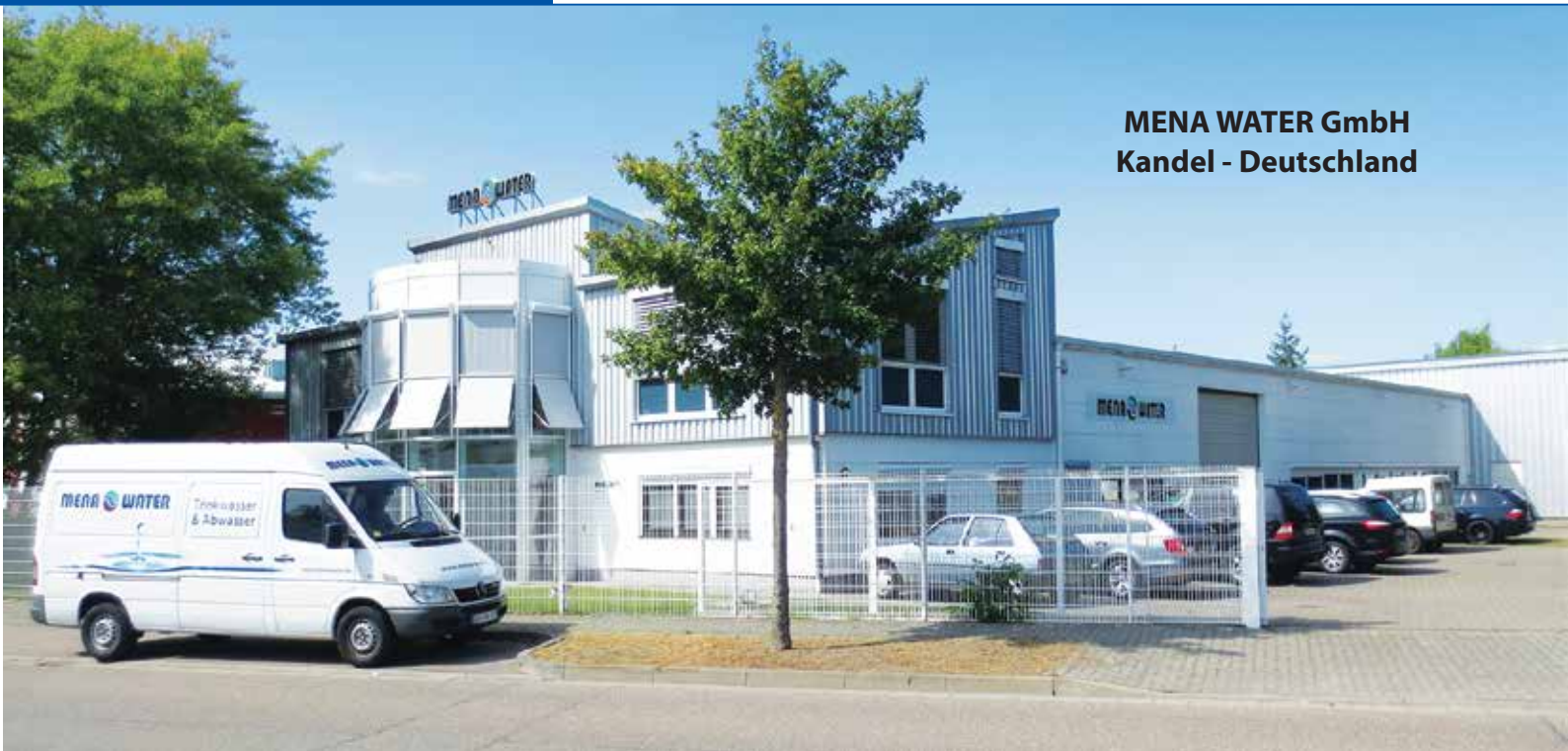
MENA WATER GmbH Kandel - Deutschland

MENA-Water wyznacza standardy w dziedzinie projektowania i wdrażania innowacyjnych rozwiązań i usług w dziedzinie obróbki wody i ścieków.