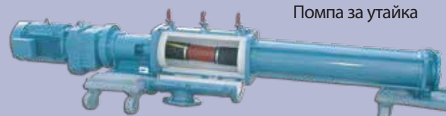
Помпа за утайка