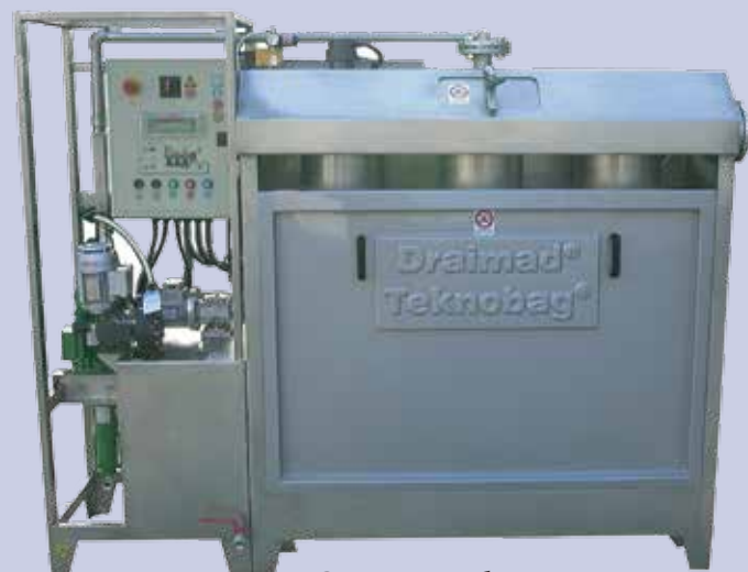
Система за обезводняване