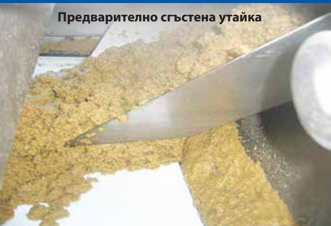
Предварително сгъстена утайка