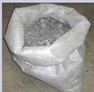
Чувал за обезводняване