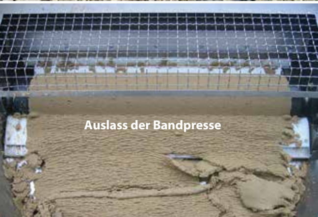
Auslass der Bandpresse