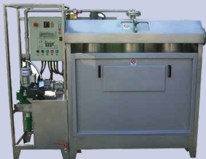
Contenedor de sacos filtrantes