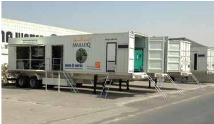
Deshidratación de lodos de Marafiq – 4 unidades móviles 4 x 8 m 3 /h, Jubail - KSA