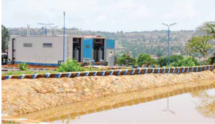
Planta potabilizadora de Bako 3000 m 3 /day, Ethiopia