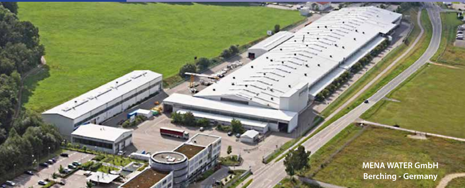
MENA WATER GmbH Berching - Germany

MENA-Water es una empresa floreciente de ingeniería y fabricación en el campo del tratamiento del agua. Nuestro principal objetivo es la conservación del medio ambiente a través de soluciones técnicas innovadoras. Para ello, estamos focalizados en el suministro de equipos de gran calidad, robustos y tecnologías avanzadas para proveer a nuestros clientes plantas de tratamiento y purificación eficientes que tengan a su vez una buena relación coste-eficiencia.