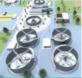
Aguas residuales Municipales