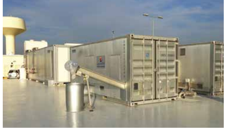
PTAR (MBR) Durran Al Bahrain 2000 m 3 /day, Bahrain