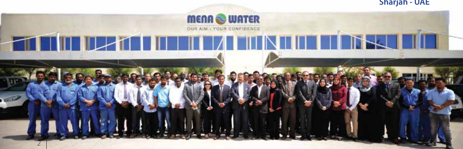
MENA WATER FZC Sharjah - UAE